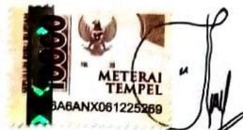
Dhara Sinta Naysilla Anggraini