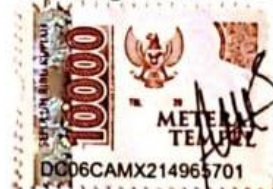
Adellya Aura Syabila