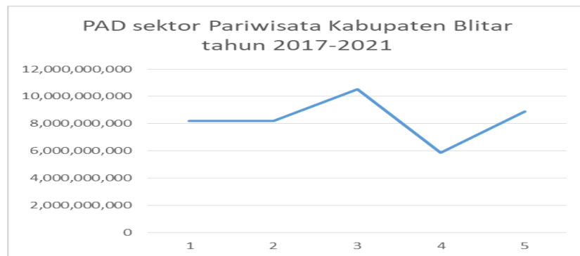
Grafik 1. Pendapatan Asli Daerah sektor Pariwisata

dikarenakan adanya pandemi COVID-19 yang melanda Indonesia dan terjadi hampir diseluruh negara. Pandemi membuat mati suri dalam hal kepariwisataan. Terjadinya pembatasan sosial dan terjadi larangan kegiatan berwisata menyebabkan PAD dari sektor pariwisata merosot tajam. Namun satu tahun kemudian yakni pada tahun 2021 terjadi kenaikan sekitar 60,19% dari tahun sebelumnya. Pada lima tahun terakhir, terhitung sejak tahun 2017 sampai tahun 2021 terjadi dua kali kenaikan yakni pada tahun 2018 mengalami kenaikan signifikan sebesar 56,27% dan kenaikan tertinggi pada tahun 2021.