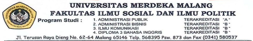
Gambar 28. Surat Keterangan Hasil Pemeriksaan Plagiasi Skripsi Mahasiswa