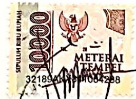
Kuntum Tunjung Ashari