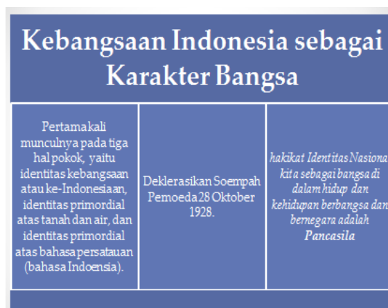
Gambar 4: Kebangsaan Indonesia sebagai Karakter Bangsa