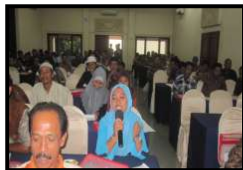
Gambar 5 : Kegiatan Seminar