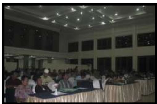
Gambar 1: Pelaksanaan Workshop dan peserta

Pancasila. b. Fungsi Perbaikan dan Penguatan Pembangunan karakter bangsa berfungsi memperbaiki dan memperkuat peran keluarga, satuan pendidikan, masyarakat, dan pemerintah untuk ikut berpartisipasi dan bertanggung jawab dalam pengembangan potensi warga negara dan pembangunan bangsa menuju bangsa yang maju, mandiri, dan sejahtera. c. Fungsi Penyaring Pembangunan karakter bangsa berfungsi memilah budaya bangsa sendiri dan menyaring budaya bangsa lain yang tidak sesuai dengan nilai-nilai budaya dan karakter bangsa yang bermartabat. Demikian ditegaskan bahwa "...ketiga fungsi tersebut dilakukan melalui (1) Penguatan Pancasila sebagai falsafah dan ideologi negara, (2) Penguatan nilai dan norma konstitusional UUD 45, (3) Penguatan komitmen kebangsaan Negara Kesatuan Republik Indonesia (NKRI), (4) Penguatan nilai-nilai keberagaman sesuai dengan konsepsi Bhinneka Tunggal Ika, serta (5) Penguatan keunggulan dan daya saing bangsa untuk keberlanjutan kehidupan bermasyarakat, berbangsa, dan bernegara Indonesia dalam konteks global."