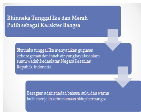
Gambar 3: Bhinneka Tunggal Ika dan Merah Putih sebagai Karakter Bangsa