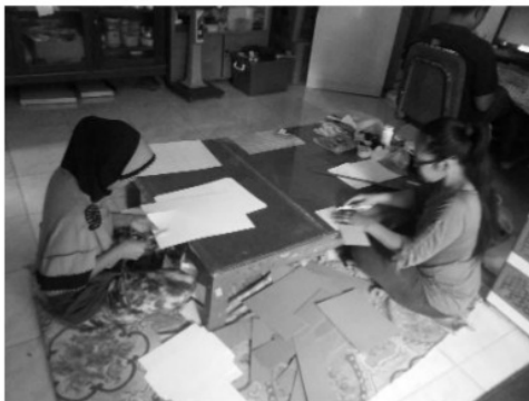
Gambar 3: Pemotongan Secara Manual