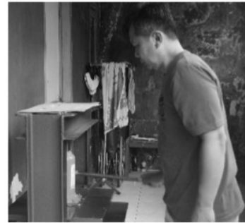
Gambar 4: Peralatan Plong Kertas/Karton Tenaga Dongkrak

Dalam mengatasi masalah kecepatan produksi dilakukan dengan pembuatan 1 buah alat plong kertas dan karton bertenaga dongkrak serta pembinaan operasional peralatan plong kertas selama 1 minggu. Dampaknya terlihat dari jumlah produk 100 buah gift box yang semula memerlukan waktu 7 hari dengan alat plong kertas/karton bertenaga dongkrak dapat diselesaikan dalam waktu 3 hari sehingga meningkatkan produktivitas lebih dari 2 (dua) kali dibandingkan produksi secara manual.