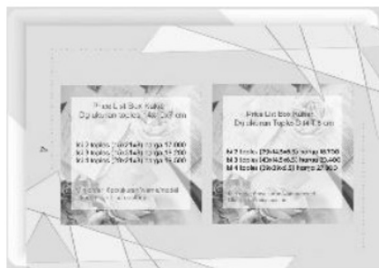
Gambar 5: Desain Katalog Produk

c. Solusi dalam mengatasi masalah Pemasaran: