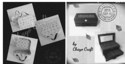
Gambar 1. Produk Gift Box

Bahan yang digunakan untuk membuat gift box cukup sederhana, diantaranya karton Jepang tebal, kertas kado, kertas hvs/samson, isolasi kertas, lem putih dan pita. Peralatan yang digunakan dalam memproduksi gift box juga sederhana, antara