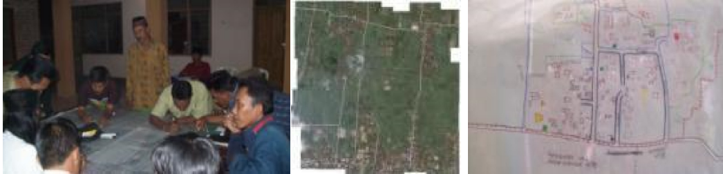
Gambar 4: Pemetaan Swadaya