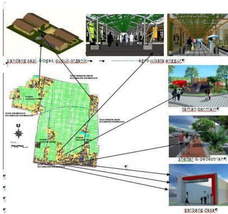
Gambar 8: Interpretasi Kebutuhan Warga Oleh Tenaga Ahli Perencanaan Partisipatif