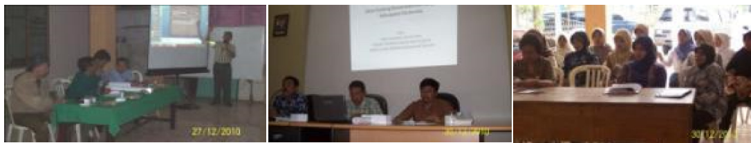
Gambar3: Sosialisasi, koordinasi, rembug warga