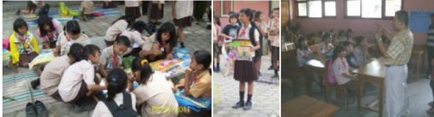
Gambar 5: Menggambar kampung impian dan menyepakati aturan bersama tingkat SD