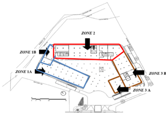
Gambar 4. Rencana Zoning Pekerjaan Pada Proyek Apartemen X Kota Malang