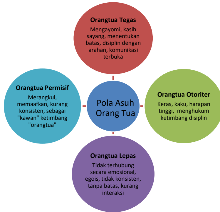
Gambar 1 Pola Asuh Orang Tua

menasehati, pemberian reward jika anak berbuat kebaikan dan berprestasi, pola asuh lainnya bisa berupa tegas, otoriter, dan pola asuh yang lepas (Luo, LeMonda, & Song, 2013); (Maria ulfa, 2018)., seperti pada gambar berikut: