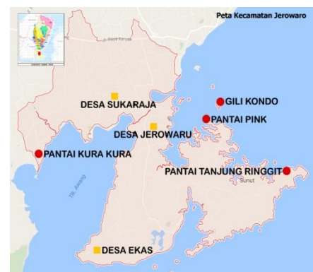
Gambar 1. Peta Kecamatan Jerowaru

Penelitian dilakukan di Kawasan wisata Jerowaru Nusa Tenggara Barat. Penulis memilih lokasi tersebut dengan pertimbangan menemukan beberapa permasalahan utamanya dalam kunjungan wisatawan dan keamanan wisatawan.