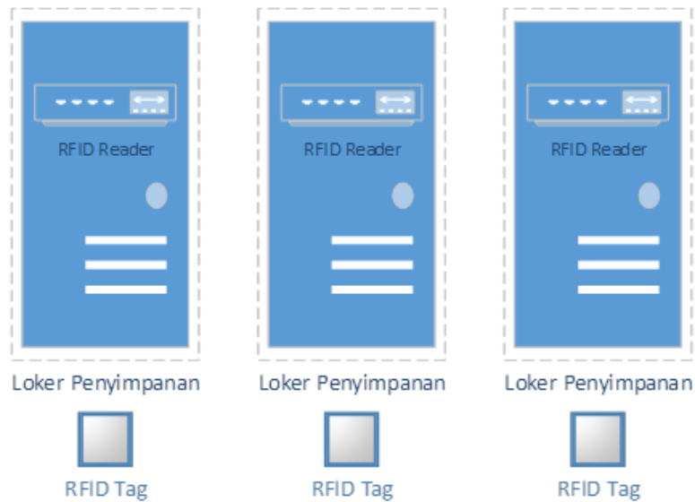
Gambar 1. Gambaran Umum Sistem Keamanan Loker Penitipan Barang dengan RFID

Penelitian yang dilakukan adalah membuat system keamanan loker penitipan barang dengan menggunakan RFID. Sistem yang akan dibuat berupa software untuk mikrokontroller dalam perintah proses buka dan kunci loker dengan memanfaatkan RFID dan hardware yang terdiri dari loker penyimpanan, mikrokontroller, motor DC dan kunci, serta RFID Reader beserta RFID tag. Gambaran umum perancangan seperti pada gambar 1 berikut :