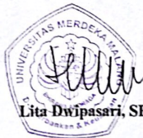
Lita Dwipasari, SE., MM