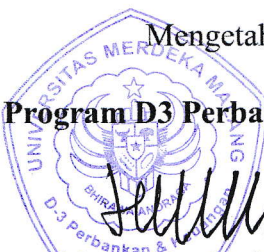
Lita Dwipasari, SE., MM