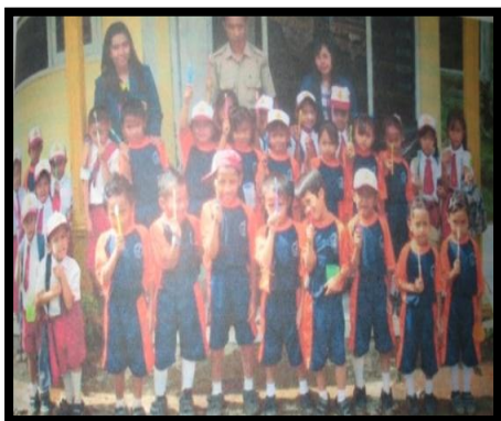
Gambar 11. Praktek sikat Gigi kelas 1-2