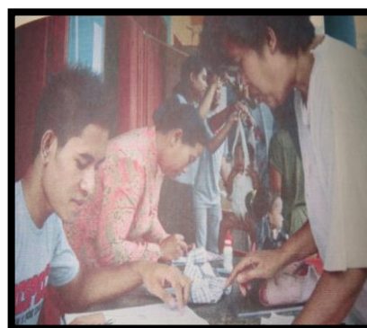
Gambar 9. Pemberian tambahan Gizi Anak Usia Dini