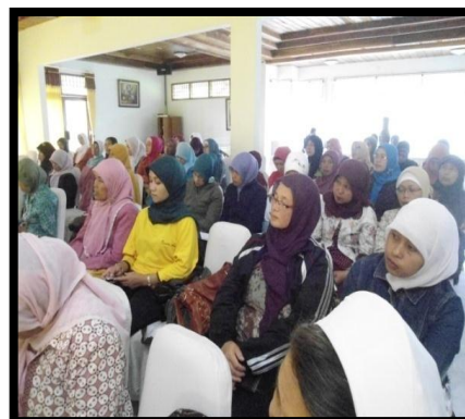
Gambar 4. Peserta seminar ibu ibu guru PAUD