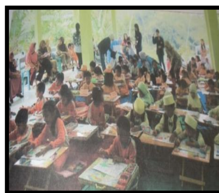
Gambar. 13. Pelaksanaan lomba mewarna