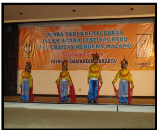
Gambar 5. Peserta lomba Tari Kupu-Kupu

Sehat, bahagia dan sejahtera merupakan idaman setiap keluarga. Dengan kondisi ini kemakmuran keluarga akan tercapai, tim bersama posdaya memberikan sumbangan makanan bergizi untuk meningkatkan kesehatan bagi keluarga, dimana sasaran program adalah kesehatan anak. Adanya program ini mendapat sambutan baik dari para kader kesehatan karena dengan pemberian dana ini maka akan menambah asupan gizi bagi warga yang kurang mampu. Untuk tambahan gizi bagi balita ini dikelola oleh posyandu dibantu tim dan beberapa mahasiswa sebagai relawan, Tambahan gizi yang dilakukan dengan memberikan kacang hijau, sayur sup dan sebagian susu balita.