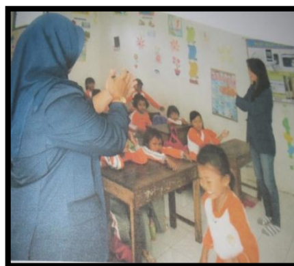
Gambar 12. penjelasan tentang lomba

Anak-anak merupakan asset Negara, sehingga perlu untuk mendapat pemberdayaan juga, cara mudah memberdayakan anak-anak adalah memberikan kegiatan sesuai dengan kemampuan fisik dan kecerdasan mereka, salah satu cara memberdayakan anak-anak adalah dengan mengikutkan mereka dalam kegiatan lomba mewarna. Dengan adanya lomba ini akan merangsang mereka untuk kreatif dan bersaing sehat.