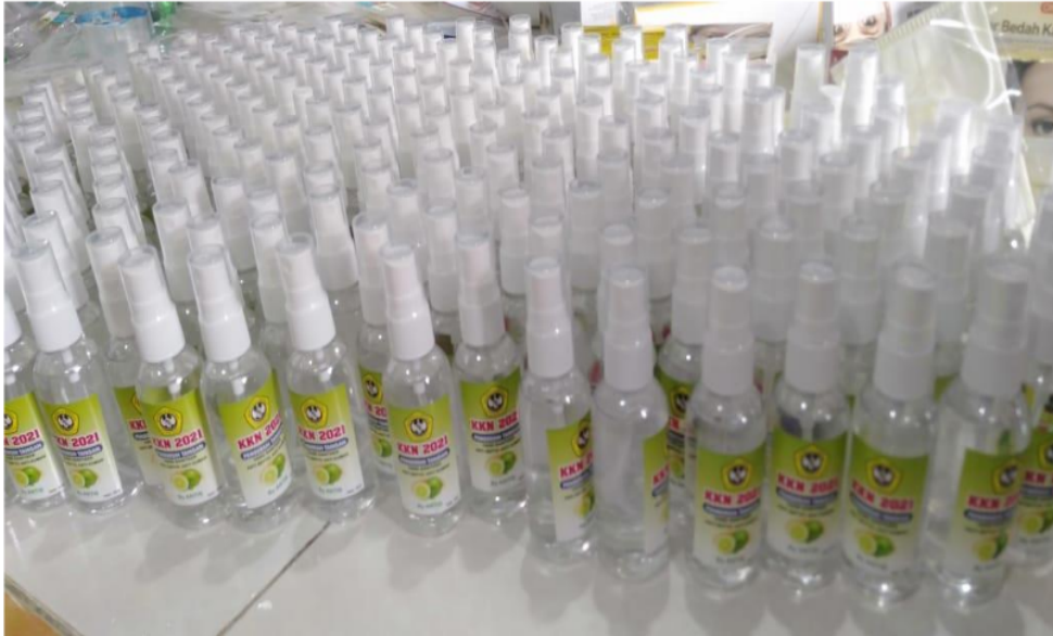
Keterangan Gambar : Hand Sanitizer 60ml merk Antis sejumlah 500 Unit.