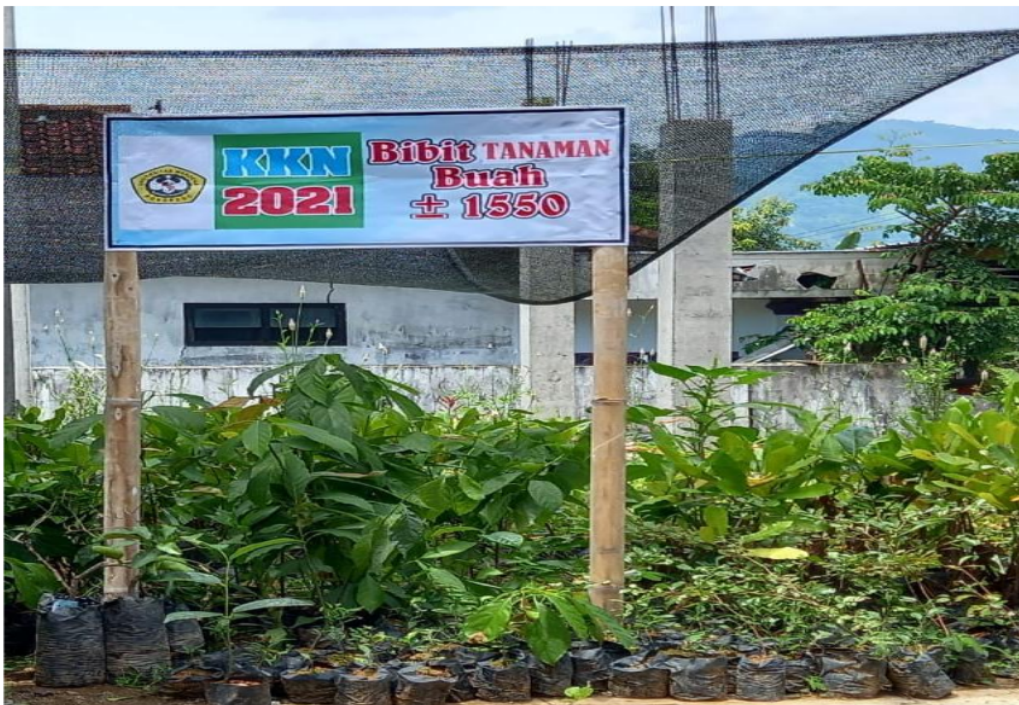
Keterangan Gambar : Bibit Tanaman Buah -/+ 1550