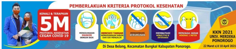
Keterangan Gambar : Spanduk 5M