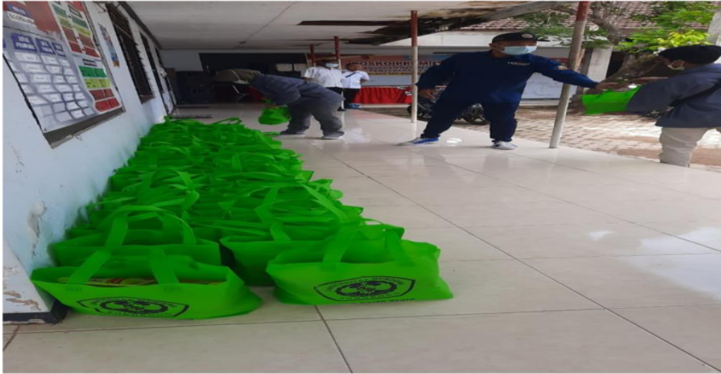
Keterangan Gambar : Paket Sembako