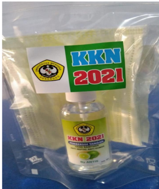
Keterangan Gambar : Paket Hand Sanitizer, Masker dan Brosur.