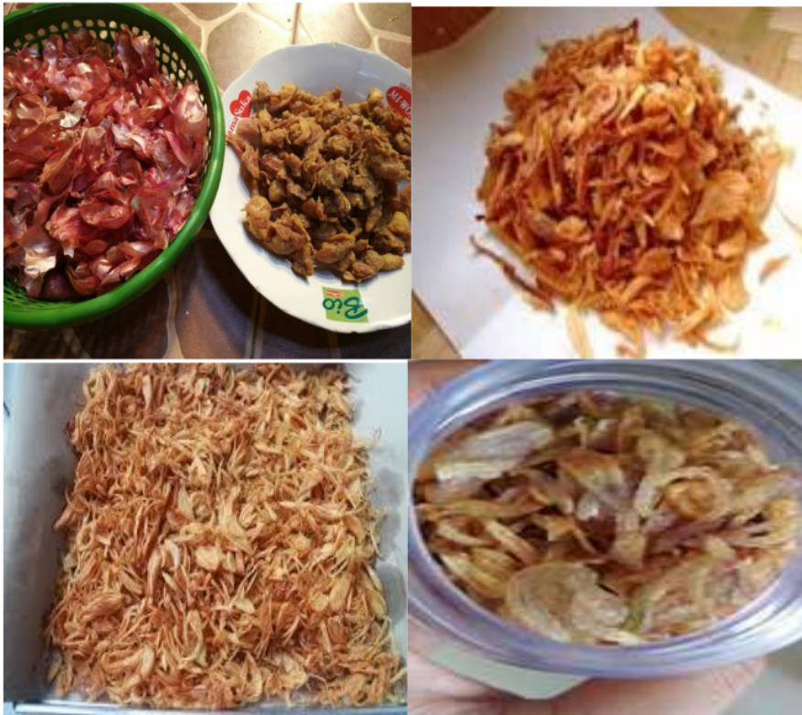
Gambar 2 Proses pengolahan camilan bawang aneka rasa

Bawang merah merupakan salah satu komoditas tanaman hortikultura yang banyak dikonsumsi manusia sebagai campuran bumbu masak setelah cabe (Hidayati, at.el., 2018). Salah satu kegiatan yang akan dilakukan berdasarkan permasalahan di atas adalah kegiatan Pengabdian Kepada Masyarakat berupa pemanfaatan limbah kulit bawang merah dengan berbentuk camilan. Kulit bawang dimanfaatkan untuk diolah menjadi camilan bersifat agar lebih bisa dimanfaatkan menjadi camilan bernutrisi dan memiliki nilai ekonomis dari pada dibuang. Bahan-bahan yang digunakan untuk membuat camilan kulit bawang cukup tersedia di masyarakat sehingga mudah dalam pembuatan. Camilan kulit bawang menghasilkan nutrisi vitamin yang bagus dikonsumsi untuk tubuh manusia. Sehingga camilan kulit bawang ini memiliki nilai ekonomis sehingga potensial untuk meningkatkan taraf perekonomian masyarakat.