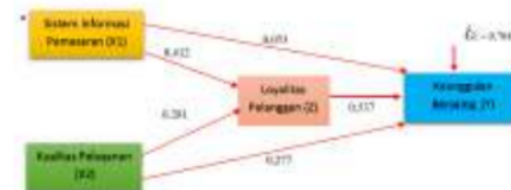
Gambar 2 : Model Jalur Struktural 2

Mengacu pada output hasil regresi Model II dapat diketahui nilai signifikan dari kedua variabel yaitu X_1 = 0,000 dan X_2 = 0,000 lebih kecil dari 0,05. Hal ini memberikan kesimpulan bahwa regresi model II yakni Variabel X_1 dan X_2 berpengaruh signifikan terhadap Z . Besarnya nilai R atau R Square yang terdapat pada tabel Model Summary adalah sebesar 0,505, hal ini menunjukkan bahwa kontribusi atau sumbangan pengaruh X_1 dan X_2 terhadap Z adalah sebesar 50,5 %, sementara sisanya sebesar 49,5% merupakan kontribusi dari variabel-variabel lain yang tidak dimasukkan dalam penelitian ini. Sementara itu nilai e_1 = V(1 - 0,505) = V(0,495) = 0,704 . Adapun dari hasil yang diperoleh dapat dibuat jalur model Struktur II sebagai berikut :