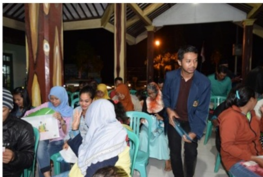
Gambar 1. Pelatihan bahasa Inggris yang dibantu oleh para mahasiswa

Setelah penyuluhan, warga desa juga diberikan pelatihan bahasa Inggris yang memberikan dasar-dasar dalam berinteraksi dengan wisatawan asing sebanyak delapan pertemuan. pelatihan ini diikuti oleh dua Karang Taruna yaitu Karang Taruna Maron, dan Karang Taruna Sukoanyar. Ada tujuh materi yang dipelajari yaitu Greeting, Asking for and Giving Assistance, Telephoning, Giving Direction, Numbers, Shopping, at a Specific Place . Pelatihan ini dilakukan sekali dalam seminggu yaitu pada hari Jum'at yang dimulai pada tanggal 23 Maret 2018. Kegiatan pelatihan dapat dilihat pada Gambar 1.