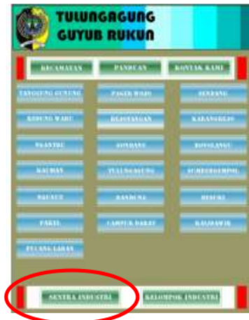
Gambar 4. Menu Sentra Industri

Menu sentra industri menyajikan rincian data UMKM berdasarkan nama sentra atau komoditi atau nama produk. User dapat mengakses informasi sentra industri dengan cara klik menu sentra industri di menu utama. Rincian data sentra industri dapat dilihat pada gambar dibawah ini. 12