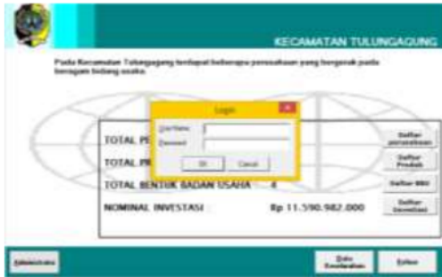
Gambar 5. Halaman login administrator

User dan Password. Admin dapat mengakses menu administrator melalui menu profil kecamatan. Halaman login administrator dapat dilihat pada gambar di bawah ini.