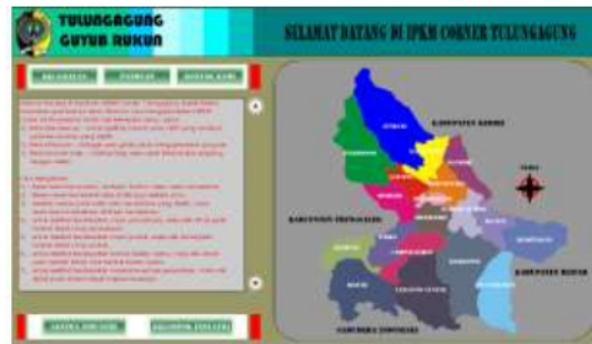
Gambar 3. Menu Panduan

Menu panduan berisi langkah-langkah atau tata cara penggunaan atau pengoperasian program. User dapat mengakses menu panduan dengan cara klik menu panduan dari menu utama. Tampilan panduan dapat dilihat pada gambar di bawah ini. 15