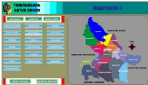
Gambar 2. Menu utama

Halaman menu utama disajikan dengan tampilan berbasis peta yang terbagi per kecamatan, dilengkapi juga dengan menu 19 kecamatan, panduan, kontak kami, sentra industri, dan kelompok industri. Pada halaman ini user dapat mengakses data berdasarkan lokasi kecamatan, data sentra industri, bahkan data kelompok industri.