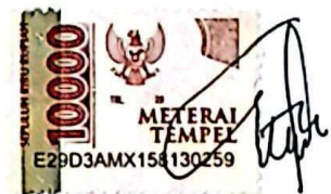
Agnes Nona Sio Atawuwur