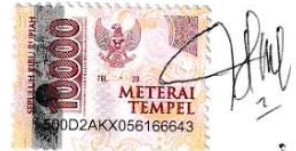
Afifah Wishal Saputri