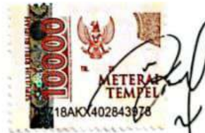
Afifah Nur Suffiati