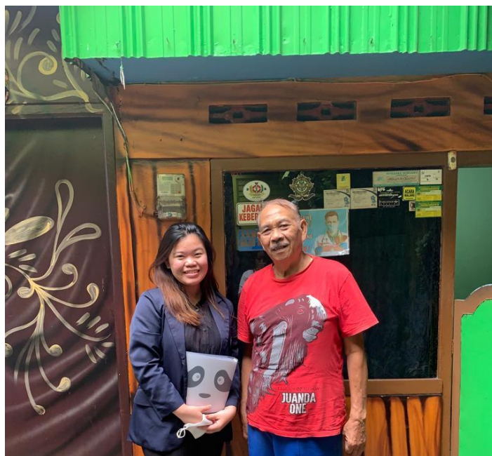
(Wawancara Kepala RW Kampung Warna Warni Jodipan)