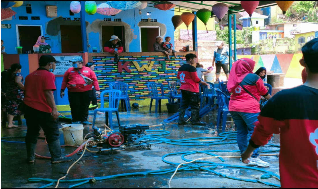
(Gotong Royong membersihkan dampak banjir Bandung)