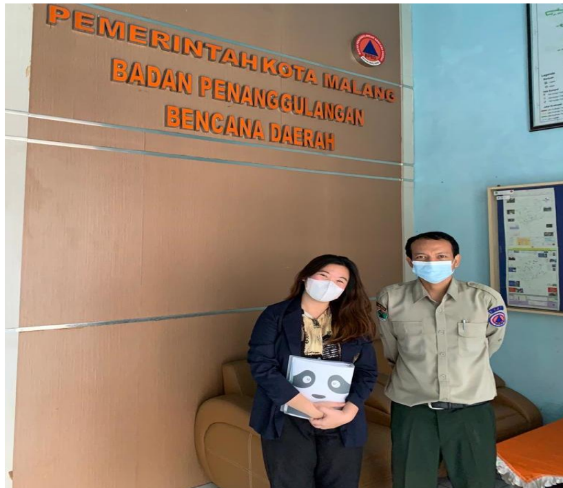
(Wawancara pegawai BPBD Kota Malang)