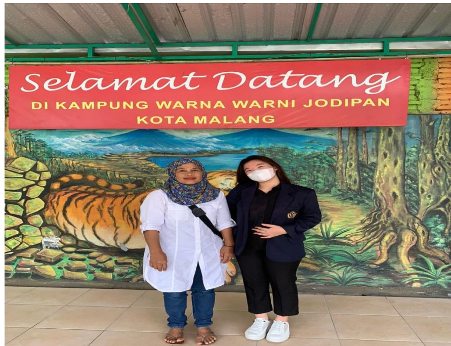
(Wawancara masyarakat terdampak banjir bandang)