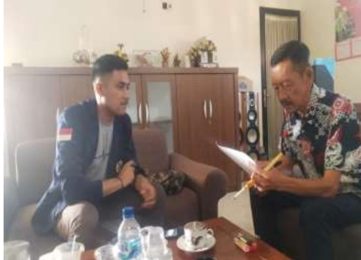
Sumber : Dokumentasi Lapangan

”Kerjasama adalah Kunci Keberhasilan, Keikhsan bekerja adalah kunci menuju kesuksesan, Koordinasi antara masyarakat, pemerintah dan BPD berjalanlancar tanpa menemui kendala yang berarti. BPD selalu ikut berperan dalam pengawasan pembangunan.”