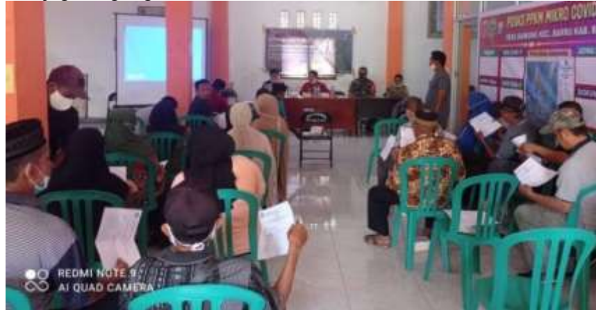
Gambar 3 : Dokumentasi pertemuan sosialisasi aturan/kebijakan menjaga lingkungan.