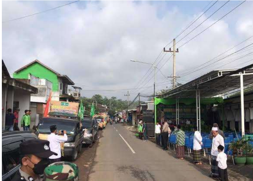
Gambar 6 : Pengawasan kegiatan masyarakat