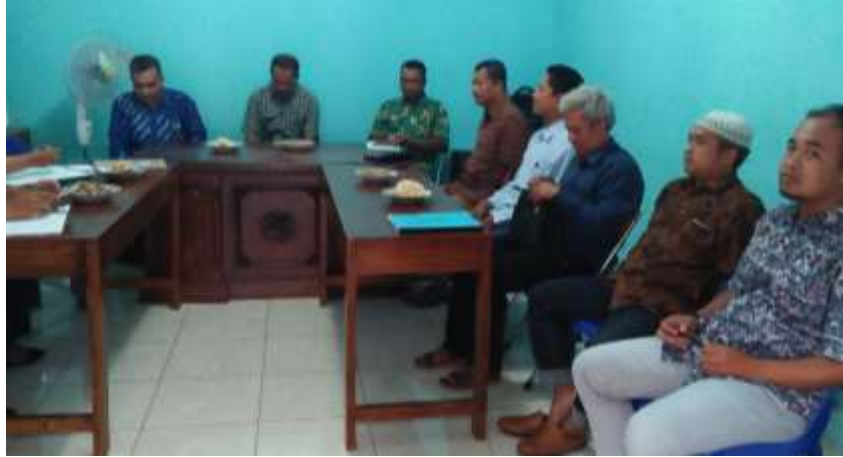
Gambar 3 : Laporan pertanggungjawaban pemerintah desa pandanlandung