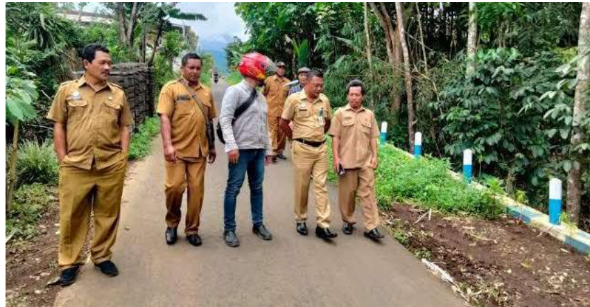
Gamabar 4 : kunjungan lapangan

atas, mengsosialisasikan kepada masyarakat terkait pentingnya kebijakan yang sudah di buat adalah yang terpenting.