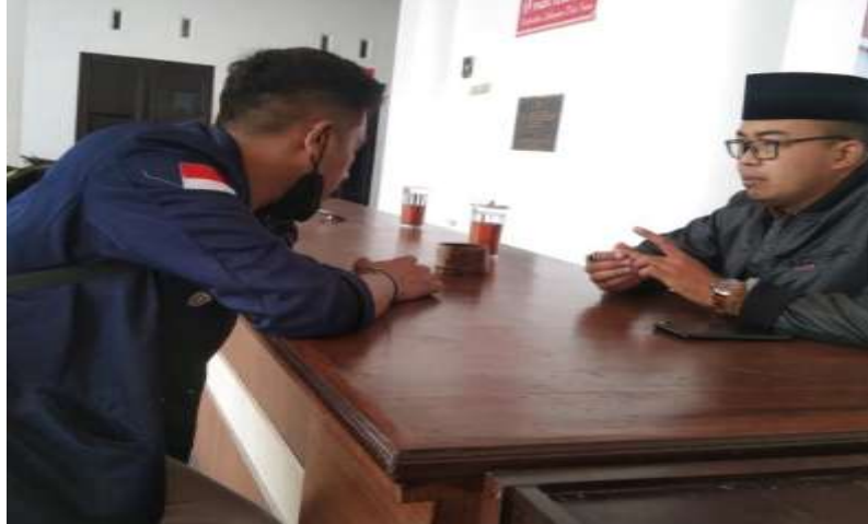
Gambar 6 : Wawancara Bersama anggota BPD