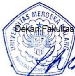
(MAULID AGUNG TRIONO, SE., MM)