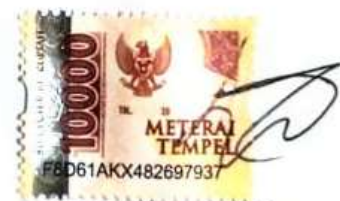
Anselmus sani liwun