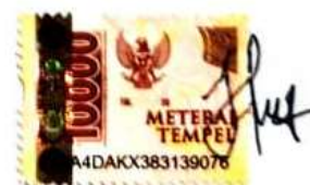
Melina Isabel Tampani