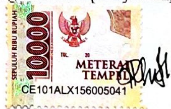
Yohana Awa Bupu

Malang, 1 Agustus 2024 Yang membuat pernyataan,