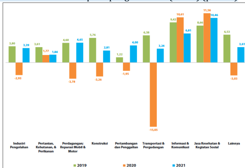
Gambar 1 Pertumbuhan PDB Beberapa Lapangan Usaha (c-to-c) (persen)

Penurunan pendapatan perusahaan merupakan masalah yang serius bagi perusahaan karena ada kaitannya dengan keuntungan atau laba perusahaan. Pada tahun 2022 Badan Pusat Statistik (BPS) melakukan survei yang menghasilkan perbandingan pertumbuhan ekonomi dari tahun 2019 hingga 2021. Berikut ini grafik hasil survei Badan Pusat Statistik (BPS):