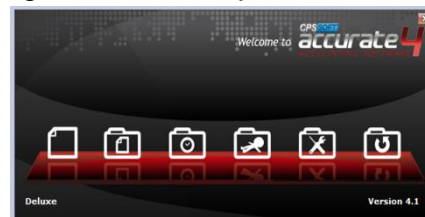
Gambar 3. Accurate Starting Display Setup Database

Pada saat pertama kali membuka Accurate v.4 akan terlihat display yang memiliki enam gambar icon di mana akan muncul keterangan tentang icon tersebut apabila cursor diarahkan di atas icon . Accurate menampilkan display atau tampilan yang lebih modern atau tampilan yang berbeda dari software akuntansi lain.