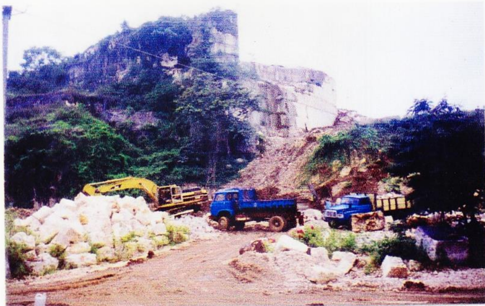
Gambar 8: Lalu lintas kendaraan berat pengangkut marmer yang mungkin membahayakan pengunjung.