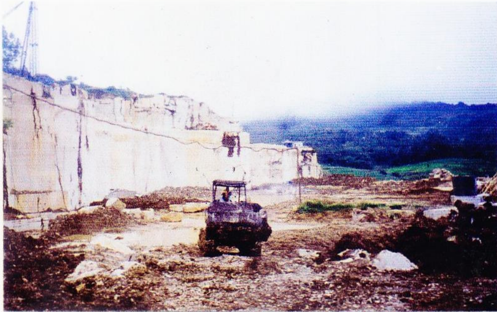
Gambar 7: Lingkungan area tambang yang memerlukan pengembangan untuk kenyamanan pengunjung