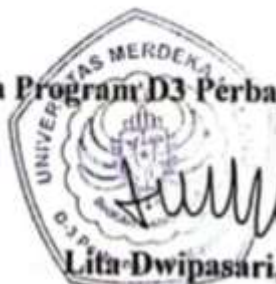
Lita Dwipasari, SE., MM