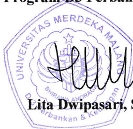
Lita Dwipasari, SE., MM