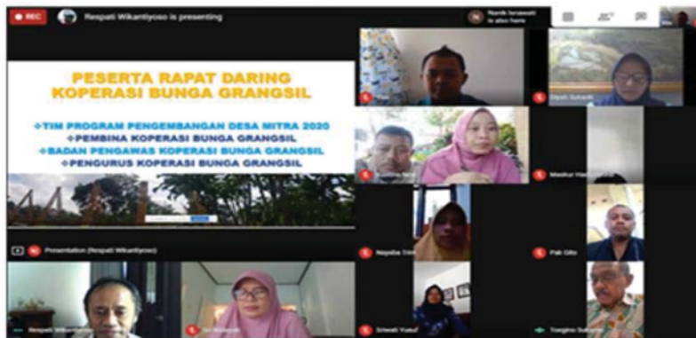
Gambar 5. Pertemuan daring pendampingan Koperasi Boenga Grangsil

Respati Wikantiyoso, Diyah Sukanti Cahyaningsih , Aditya Galih Sulaksono, Sri Widayati