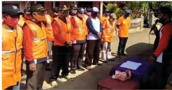
Gambar 7. Sambutan kepala Desa Jambangan dalam acara operasi tertib

Tim PPDM2020 memandang penting untuk membentuk tim siaga COVID-19 di level KBG dan tim satuan tugas COVID-19 untuk level Dusun Grangsil dan Desa Jambangan yang bertugas sebagai tim penanggulangan penyebaran COVID-19 di Dusun Grangsil, khususnya di destinasi wisata Kampoeng Boenga Grangsil. Struktur organisasi tim penanggulangan penyebaran virus corona (COVID-19), disahkan oleh Kepala Desa Jambangan, Kecamatan Dampit, Kabupaten Malang. Pelibatan kepala desa dalam penyusunan dan pembuatan surat struktur organisasi satuan tugas COVID-19 oleh Kepala Desa Jambangan. Mitra diminta untuk memberikan informasi, serta selalu koordinasi dengan pemerintah desa dan tim. Pemerintah Desa Jambangan sangat mendukung untuk pembentukan tim siaga COVID-19 maupun satgas COVID-19. Kegiatan pertama tim penanggulangan penyebaran COVID-19 adalah operasi tertib masker, pada hari Sabtu 18 Juli 2020. Sarasan operasi adalah pengunjung KBG dan masyarakat sekitar KBG.