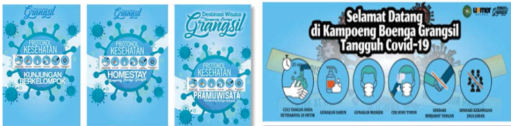
Gambar 9. Beberapa contoh protokol COVID-19

Penyusunan protokol-protokol kesehatan terkait dengan menyongsong new normal order , untuk kelengkapan dan penyiapan fasilitas dan kegiatan-kegiatan menyongsong masa transisi menuju new normal order (Gambar 8 dan 9). Pelaksanaan diawali dengan kegiatan FGD, diskusi Tim PPDM2020 yang membahas tentang fasilitas serta kegiatan-kegiatan yang dimungkinkan masih bisa dilaksanakan pasca pandemi COVID-19 atau pada masa transisi menuju new normal . Penyusunan panduan pertemuan daring dan protokol-protokol kesehatan. Karena pandemi COVID-19, dengan adanya protokol social distancing , serta physical distancing , maka pelaksanaan pertemuan harus dilaksanakan secara daring. Khususnya untuk kegiatan rapat yang melibatkan Tim PPDM.