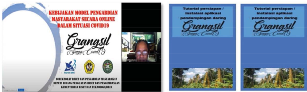
Gambar 3. Pertemuan daring tim PPDM kebijakan Kemenristek/BRIN Gambar 4. Buku saku tutorial persiapan/instalasi aplikasi pendampingan daring

Mempersiapkan tim dan mitra (Tim Kampoeng Boenga Grangsil) untuk menangani secara serius terhadap permasalahan tantangan penyebaran pandemi COVID-19. Langkah pertama adalah melakukan pertemuan daring tim PPDM untuk mendalami kebijakan Kemenristek/BRIN ini (Gambar 2). Kemudian menyiapkan pertemuan daring dengan manajemen KBG (di Dusun Grangsil), permasalahan muncul karena masyarakat belum pahan tentang online system . Sehingga perlu disusun panduan pertemuan daring (Gambar 3), yang digunakan untuk pedoman penggunaan daring (dilakukan komunikasi dengan WA) antara tim PPDM dengan Mitra KBG.