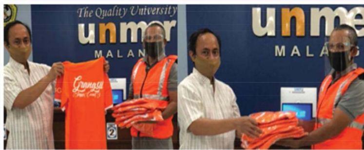
Gambar 6. Penyerahan peralatan pencegahan COVID-19 di Kampus Unmer Malang

Dalam rangka menjawab permasalahan tentang kemampuan mengatasi permasalahan pandemi COVID-19 secara kelembagaan perlu dilakukan beberapa kegiatan penguatan kelembagaan. Kegiatan ini bertujuan untuk menciptakan kondisi resilience destination management atau kondisi manajemen yang tangguh menghadapi COVID-19. Kemampuan secara kelembagaan untuk mengantisipasi, mencegah, dan mengatasi penyebaran pandemi COVID-19 menjadi prasyarat untuk menyusun protokol COVID-19. Peningkatan kemampuan ini dilakukan dengan pendampingan online , memberikan bantuan hibah untuk pelaksanaan protokol COVID-19. Bantuan hibah peralatan diantaranya: (1) Masker untuk masyarakat sebanyak 250 buah (dari donatur), dan 200 buah masker untuk mendukung operasi tertib bermasker yang diselenggarakan tim satgas COVID-19; (2) 4 buah thermo gun untuk operasional harian pengunjung/wisatawan; (3) Faceshield sebanyak 30 buah untuk Tim KBG dan satgas COVID-19; (4) Rompi satgas sebanyak 20 buah untuk tim satgas COVID-19; dan (5) Kaos seragam siaga COVID-19 sebanyak 30 buah untuk tim operasional KBG.