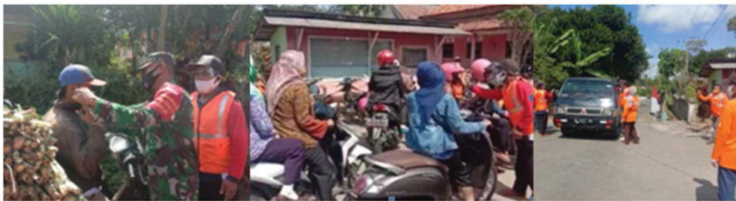
Gambar 8. Rangkaian kegiatan operasi tertib masker di KBG.

Pembentukan satgas COVID-19 Kampoeng Boenga Grangsil, paling tidak dapat mencegah penyebaran COVID-19 ini. Upaya ini sangat penting untuk meningkatkan kesadaran, masyarakat, pengunjung, dan petugas wisata dalam melaksanakan dan mematuhi protokol kesehatan. Dalam upaya mencegah penularan COVID-19, Wisata Kampoeng Boenga Grangsil membentuk satgas COVID-19 dan mengadakan kegiatan disiplin masker di Kawasan Dusun Grangsil Desa Jambangan Kecamatan Dampit pada Sabtu 18 Juli 2020 bersama Muspika Dampit, Koramil, kecamatan, Babinsa, Puskesmas Dampit, kepala desa dan perangkat serta Tim KBG (Gambar 7). Kegiatan ini dilaksanakan agar warga dan pengunjung KBG disiplin dan mengenakan masker saat keluar rumah, serta mematuhi protokol kesehatan sesuai dengan ketetapan pemerintah. Pemberitaan terdapat pada https://bit.ly/ppdm2020disiplinmasker dan link Youtube https://bit.ly/operasimasker .