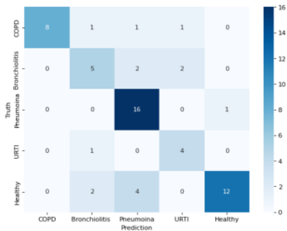
Gambar 2. Confusion Matrix hasil Klasifikasi

Dari Tabel 2 Hasil Klasifikasi menunjukkan sejumlah metrik evaluasi yang penting dalam mengevaluasi performa model klasifikasi. Precision mengukur sejauh mana model mampu mengklasifikasikan dengan benar suara pasien berdasarkan jenis penyakit pernapasan. Recall mengukur sejauh mana model dapat mengidentifikasi secara akurat jumlah kasus penyakit yang sebenarnya. F1-score menggabungkan precision dan recall menjadi satu nilai yang merepresentasikan keseimbangan antara keduanya. Support mengindikasikan jumlah sampel data yang termasuk dalam setiap kelas.