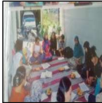
Gbr. 5 Pelatihan Pembuatan Kue kering dan Kue Basah