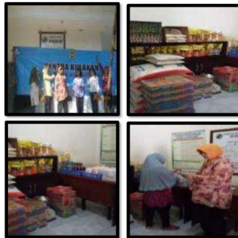
Gb 10. Sentra Kulakan Ketindan Sari Lawang