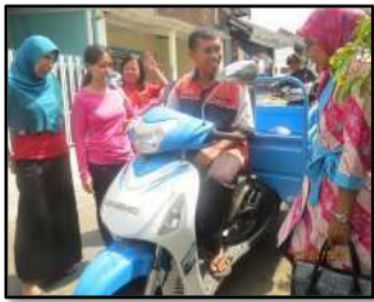
Gb 8 Penyerahan Kendaraan Niaga TOSA