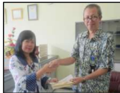
Gb 7. Penyerahan Nota Belanja dan Software Program Akuntansi

Selain pelatihan, tim juga memberikan stimulan berupa barang dagangan, software komputer akuntansi serta, kendaraan niaga berupa sepeda TOSA