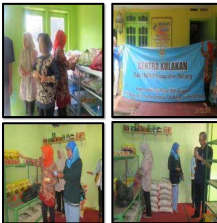
Gb 11. Sentra Kulakan Kaliartha Lawang

Perkembangan usaha selama 5 bulan mulai Mei s/d September 2015 sangat bagus, hal ini bisa dilihat dari kondisi keuangan dengan stimulan barang dagangan awal sebesar Rp 23.838.370,- berjalan 5 bulan total belanja telah mencapai Rp 64.606.570,- , penjualan bulan pertama operasional