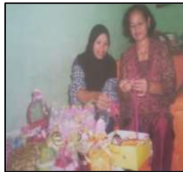
Gb 6. Pelatihan Pembuatan Handycraft