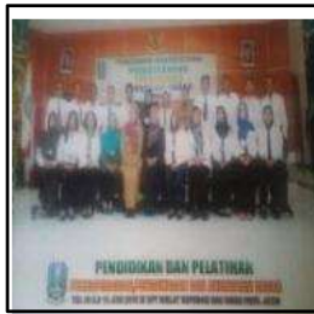
Gb 2. Pelatihan Perkoperasian, Pengawasan dan Akuntansi Dasar