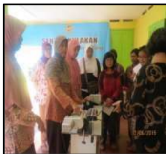
Gb 4. Pelatihan Pembuatan Kue Kering