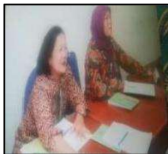
Gb 3. Pelatihan Perpajakan

Selain pelatihan, tim juga memberikan stimulan berupa barang dagangan, software komputer akuntansi serta, kendaraan niaga berupa sepeda TOSA