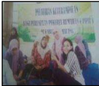
Gbr. 1. Pelatihan Pembukuan Sederhana