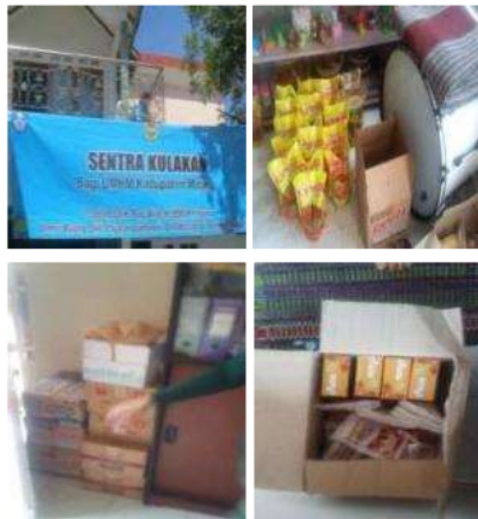
Gb. 9. Sentra Kulakan Lumbang Artha Jaya Ngijo Karangploso

Selain terbentuk beberapa sentra kulakan baru, kegiatan yang lain adalah membina UMKM baik yang baru maupun yang sudah lama namun tidak berkembang. Adanya sentra kulakan ini mendapat respon dari pelaku UMKM untuk membuka kembali usahanya dan ada pula yang membuka usaha baru dengan menggunakan fasilitas pembelian bahan dari sentra dengan cara pembayaran mengangsur.