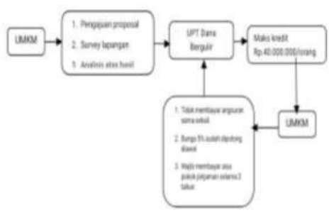
Gambar 1. Pola Penundaan angsuran kredit dana bergulir bagi UMKM

Sebab pada prakteknya terdapat perbedaan yang signifikan antara penundaan kredit dana bergulir dengan kredit perbankan. Secara umum pada perbankan yang terjadi adalah menunda pembayaran angsuran pokok tetapi hanya membayar bunganya saja dan itu akan menambah jangka waktu angsuran dengan pola restrukturisasi kredit baru. Tetapi hal itu tidak terjadi pada nasabah dana bergulir sebab dalam penerapan penundaan kredit tersebut mereka tidak membayar angsuran sama sekali. Bunga pada nasabah dana bergulir memang sudah dipotong pada awal penerimaan kredit yang disetujui. Bunga yang dibebankan hanya sebesar 5 % dari total pinjaman sehingga hanya diwajibkan membayar sisa pokok pinjaman saja selama jangka waktu dua tahun. Di bawah ini adalah Pola penundaan angsuran kredit dana bergulir bagi UMKM.