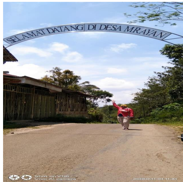
Gambar 1 dan 2 : Tim Pengabdian UNMER Ponorogo didaerah Desa Mrayan, Ngrayun.