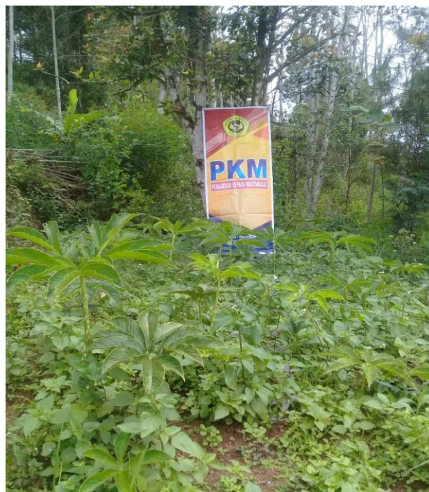
Gambar 5, 6 Alat semprot pupuk bantuan dari Tim Pengabdian Unmer Ponorogo dan Tanaman Porang di Lahan Desa Mrayan, Ngrayun milik beberapa petani