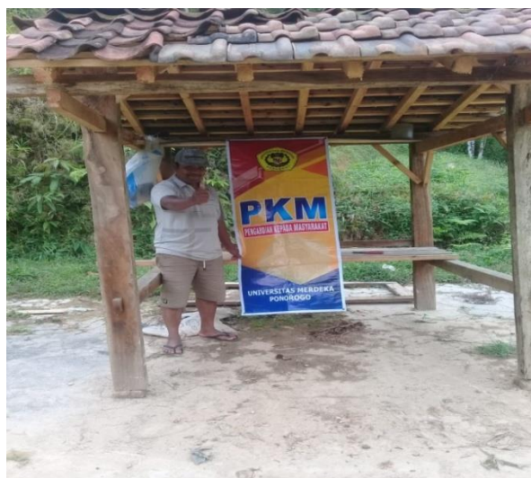
Gambar 3, 4

Dangau yang direferensi dan sekaligus bantuan oleh Tim pengabdian kepada petani porang untuk berteduh dan beristirahat dari hujan dan panas, juga melakukan pengawasan secara langsung pada tanaman porang dari risiko kecurian.