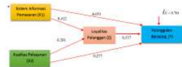
Gambar 2 : Model Jalur Struktural 2 Sumber : Olahan peneliti, 2019

Mengacu pada output hasil regresi Model II dapat diketahui nilai signifikan dari kedua variabel yaitu X_1 = 0,000 dan X_2 = 0,000 lebih kecil dari 0,05. Hal ini memberikan kesimpulan bahwa regresi model II yakni Variabel X_1 dan X_2 berpengaruh signifikan terhadap Z . Besarnya nilai R atau R Square yang terdapat pada tabel Model Summary adalah sebesar 0,505, hal ini menunjukkan bahwa kontribusi atau sumbangan pengaruh X_1 dan X_2 terhadap Z adalah sebesar 50,5 %, sementara sisanya sebesar 49,5% merupakan kontribusi dari variabel-variabel lain yang tidak dimasukkan dalam penelitian ini. Sementara itu nilai e_1 = \sqrt{1 - 0,505} = \sqrt{0,495} = 0,704 . Adapun dari hasil yang diperoleh dapat dibuat jalur model Struktur II sebagai berikut :