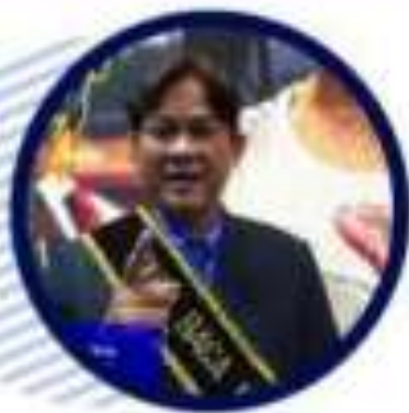
Gol A Gong

"MENUJU PERPUSTAKAAN SEKOLAH INOVATIF DAN ADAPTIF"