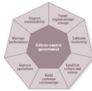
Gambar 1. Tujuh Karakteristik Pemerintahan Bebas Citizen Centric

warganya dalam memberikan layanan kepada masyarakat sehingga tujuan kesejahteraan dapat terwujud. Proses dan dinamika kebijakan yang senantiasa mengikuti perubahan tentunya menjadi kekuatan bagi pembaruan organisasi dengan menjunjung “nilai-nilai”. Nilai-nilai tersebutlah yang diistilahkan oleh Zibret et al (2009) dengan pemerintahan berbasis “ citizen centric ” yang memiliki tujuh karakteristik seperti tampak dalam gambar dibawah ini: