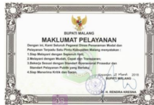
Gambar 2. Maklumat Pelayanan

Terdapat beragam agenda perubahan yang dilakukan oleh DPMPTSP Kabupaten Malang dalam memberikan layanan yang maksimal kepada masyarakat serta mendongkrak pendapat daerah. Dimulai dari komitmen pemimpin, aparatur sipil selaku individu yang memiliki batas kinerja dan memiliki tanggungjawab senantiasa menjaga integritas dalam pemberian layanan perijinan kepada masyarakat hingga membangun sebuah tatanilai dalam layanan yang ditunjukkan dalam maklumat pelayanan seperti dalam gambar berikut: