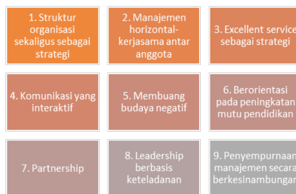
Gambar 2. Proses Terbentuknya Organizational Cultures di SMA TN

langkah terbentuknya budaya organisasi di SMA TN sebagaimana dicantumkan dalam gambar 2. adalah sebagai berikut: