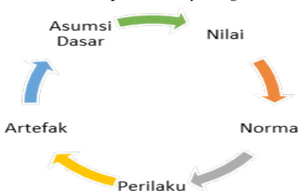
Gambar 1 Lapisan Budaya Organisasi

Mengidentifikasi lapisan budaya organisasi merupakan metode yang dapat membantu mengurai permasalahan perbedaan budaya dalam komunikasi organisasi. Hasil penelitian dari Ishak (2012), public relations yang mendapat dukungan penuh dari manajemen akan dengan mudah mengidentifikasi lapisan budaya organisasi. Dalam pendidikan, lapisan budaya tersebut merupakan kunci untuk mengetahui langkah awal dalam membangun komunikasi pendidikan yang efektif (Ishak, 2012). Lapisan budaya organisasi menurut Ishak diilustrasikan dalam gambar 1.