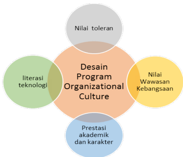
Gambar 3. Desain Program Internalisasi Membentuk Organizational Cultures