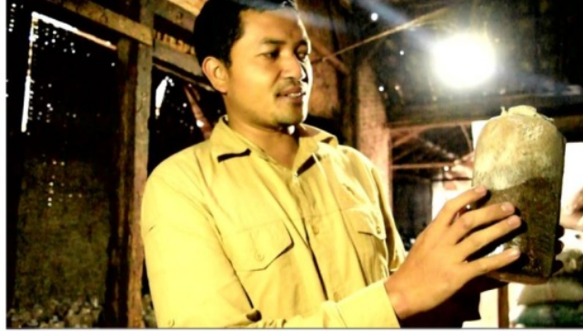
Gambar 1. Anggota karang taruna menjelaskan proses pembibitan Jamur tiram dalam Bahasa Inggris.

Selesai memberikan penyuluhan, pengabdian memberikan pelatihan Bahasa Inggris khususnya English for Tourism sebanyak 9 kali mulai tanggal 24 Maret 2018 hingga 19 Mei 2018. Materi pelatihan ini mencakup welcoming speech, showing places of interest, explaining rules, explaining safety, explaining etiquette dan closing trip .