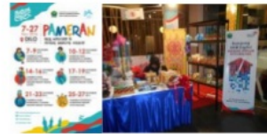
Gambar 9: Tenant dalam Pameran Produk Kreatif di Kota Malang.