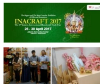
Gambar 10: Tenant dalam Pameran INACRAFT 2017 di Jakarta

Bekerjasama dengan salah satu UKM Kota Malang, tenant mengikuti pameran produk nasional yaitu INACRAFT 2017 di JICC Senayan Jakarta.