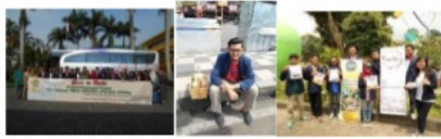
Gambar 7: Pemasaran Produk di Kawasan Alun-alun Batu