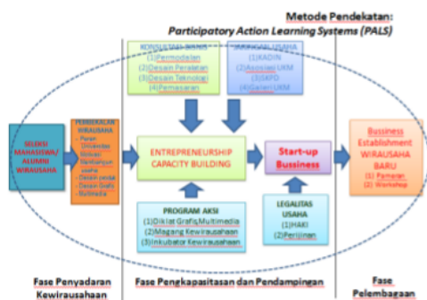
Gambar 2: Metode Participatory Action Learning Systems

alamiah dengan segala pendekatan sehingga membentuk suatu sistem interaksi pembelajaran secara partisipatif, baik secara personal maupun komunal. Metode PALS menitikberatkan pada transformasi kegiatan-kegiatan yang telah ada untuk diusahakan dibawa pada perubahan-perubahan ke arah perbaikan kondisi entrepreneurship mahasiswa melalui (1) fase penyadaran kewirausahaan ( awareness ), (2) fase pengkapasitasan ( capaciting ) dan pendampingan ( scaffolding ) kewirausahaan ( entrepreneurship capacity building ), dan (3) fase pelembagaan ( institutionalization ) usaha baru sebagai wirausaha baru. Metode pendekatan Inkubator Bisnis Mahasiswa dengan metode PALS secara digramatik ditunjukkan pada gambar 2.