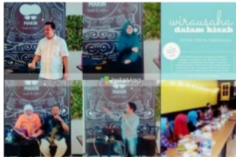
Gambar 5: Forum “Wirausaha dalam Kisah”.

Sebuah forum dengan tema “Wirausaha dalam Kisah” memperkenalkan dan mendiskripsikan sisi lain dari berbisnis kepada peserta, selain tinjauan strategis dan teknis, nilai yang hendak disampaikan yaitu “Berbisnis adalah Berketetapan dalam Hidup”.