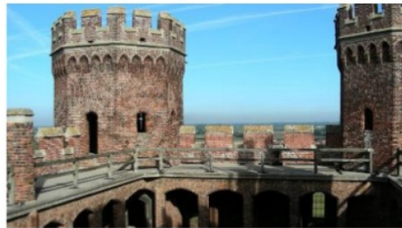
Gambar 10. Battlement dilihat dari dalam kastil

Di bagian dalam kastil, dibalik battlement , terdapat jalan sempit yang cukup untuk tempat para prajurit menembakkan panah atau senjata lain ketika berperang melawan musuh di luar kastil (lihat gambar 11).