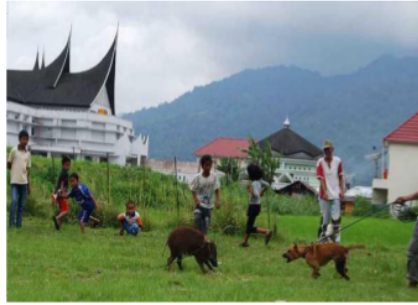
Gambar 1. Tradisi berburu babi di Minang