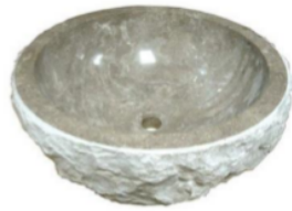
Gambar 2. Marble basin