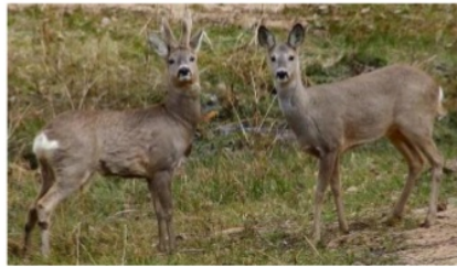
Gambar 7. Roedeer jantan (kiri) dan betina (kanan)

Prosedur penerjemahan yang sama juga diterapkan untuk penerjemahan gnus . Menurut laman http://en.wikipedia.org/wiki/Wildebeest , Gnu adalah nama lain dari Wildebeest . Hewan ini banyak ditemukan di Afrika dan merupakan penghuni asli disana. Sama halnya dengan Antelope , Gnu termasuk familia bovidae . Hewan ini merupakan mangsa terbaik bagi hewan buas di Afrika. Dalam laman http://a-z-animals.com/animals/wildebeest/ disebutkan, meskipun termasuk familia yang sama dengan antelope , gnu adalah hewan “ bull-like ”. Dari segi fisik, bentuk tubuh hewan gnus memang mirip dengan banteng. Perbedaan keduanya terdapat pada bentuk kepala dan rambut yang menjuntai di tubuh. Selain itu subfamilia yang menaungi keduanya juga berbeda. Banteng termasuk dalam subfamili bovinae dan gnu termasuk subfamili alchelapinae . Oleh karena bentuknya yang mirip dengan banteng, catatan penerjemah sejenis banteng di Afrika diberikan agar mempermudah pembaca dalam membayangkan bentuk tubuh hewan gnu .