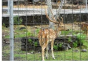
Gambar 4. Kijang yang hidup di Indonesia