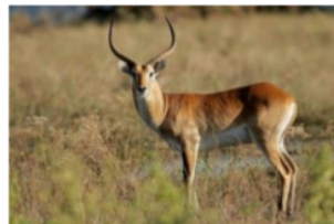
Gambar 3. Antelope Afrika