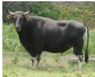
Gambar 6. Banteng yang hidup di Indonesia