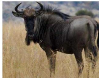
Gambar 5. Gnu Afrika

Prosedur transferensi diterapkan untuk penerjemahan tiga kata hewan: antelope , gnus , dan roedeer karena ketiadaan padanan yang sesuai di dalam BSa. Menurut http://a-z-animals.com/animals/antelope/ (diakses 10 Oktober, pkl. 9.30), Antelope adalah jenis hewan “a deer-like” yang hidup di Afrika, Asia, dan beberapa negara di Amerika. Meskipun ditemukan di Asia, antelope tidak hidup di Indonesia. Menurut laman itu, antelope disebut sebagai hewan yang mirip dengan kijang, tetapi keduanya bukan termasuk satu keluarga. Antelope termasuk familia Bovidae , sedangkan kijang termasuk Cervidae . Dari segi fisik, sebenarnya bentuk tubuh keduanya hampir tidak ada perbedaan. Perbedaannya hanya pada bagian tanduk dan corak kulit tubuh. Tanduk antelope tumbuh secara permanen, sedangkan kijang mengganti tanduk setiap setahun sekali. Meskipun begitu, penulis tidak menerjemahkannya menjadi kijang karena 1) keduanya bukan dari keluarga yang sama; dan 2) penulis bertujuan menambah pengetahuan baru untuk pembaca TSa. Dalam penerjemahannya. Catatan penerjemah sejenis kijang di Afrika akan membantu pembaca membayangkan bentuk hewan antelope dengan hewan yang ada di Indonesia, yakni kijang, tetapi yang hidup di Afrika.