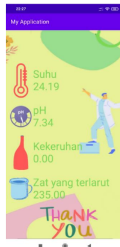
Gambar 2. Tampilan menu monitoring

Berdasarkan gambar 1 dapat diketahui bahwa pada menu aplikasi terdapat 2 sub menu yakni menu monitoring dan menu hasil.