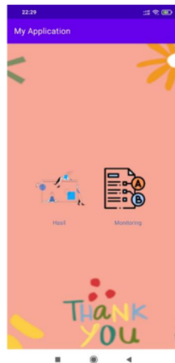
Gambar 1. Tampilan beranda aplikasi

Berdasarkan gambar 1 dapat diketahui bahwa pada menu aplikasi terdapat 2 sub menu yakni menu monitoring dan menu hasil.